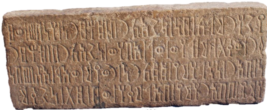
لوحة ٢: هديل - نشق ٢ (Had- Nāq 2)