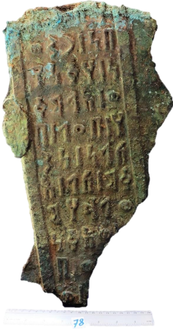
لوحة ٣: هديل - نشق ٣ (Had- Nāq 3)